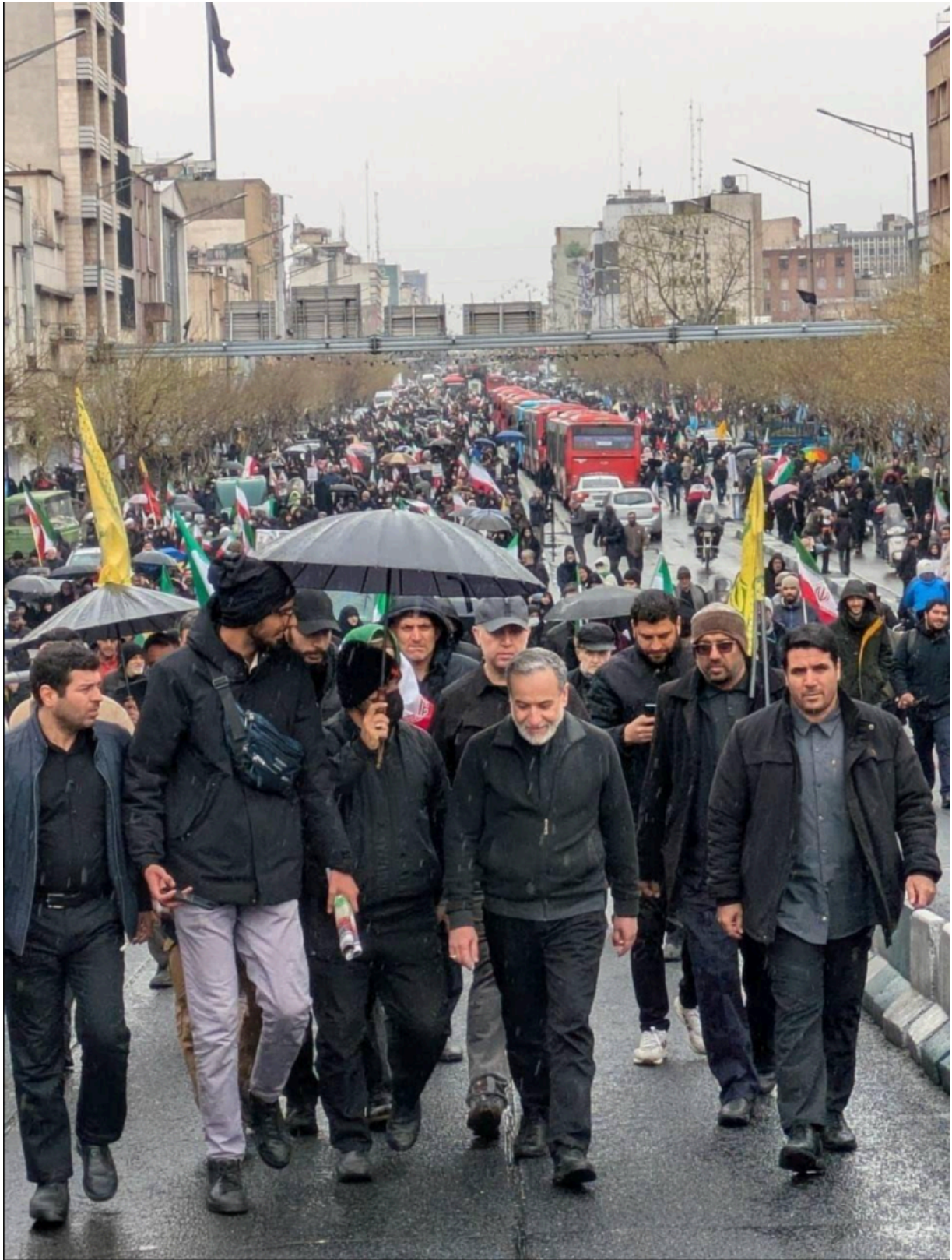
Quds Day, Teheran - Aussenminister Abbas Araghchi in inmitten des Volkes

Diese Zustimmung aus dem Volk wirkt natürlich auf die iranische Führung zurück. Der iranische Aussenminister Abbas Araghchi ist in seinen Aussagen derart souverän und gelassen, dass er wohl bleibende Spuren in den Geschichtsbüchern hinterlassen wird.