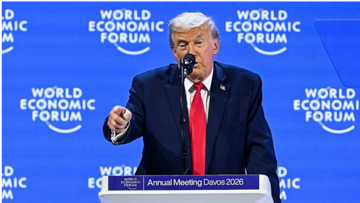
Präsident Trump, WEF, Davos, 21. Januar 2026

Bis am 21. Januar sagte Trump, dass, «die Welt nicht sicher [sei], wenn wir nicht die vollständige und totale Kontrolle über Grönland haben.“ – In seiner Davos-Rede vom 21. Januar verkündete er, dass „wir [von der NATO] nie etwas wollten oder nie etwas bekamen“ – alles, was die Vereinigten Staaten wollen ist ein Ort mit dem Namen Grönland. Weiter äusserte er, „Ich muss keine Gewalt anwenden. Ich will keine Gewalt anwenden. Ich werde keine Gewalt anwenden.“ (I don't have to use force. I don't want to use force. I won't use force.)