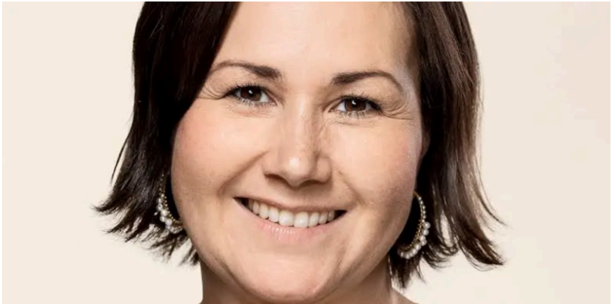
Aaja Chemnitz – Grönländische Parlamentarierin

Aaja Chemnitz seit 2015 Mitglied des Parlaments für Inuit Ataqatigiit in Grönland sieht das anders und steht auf: