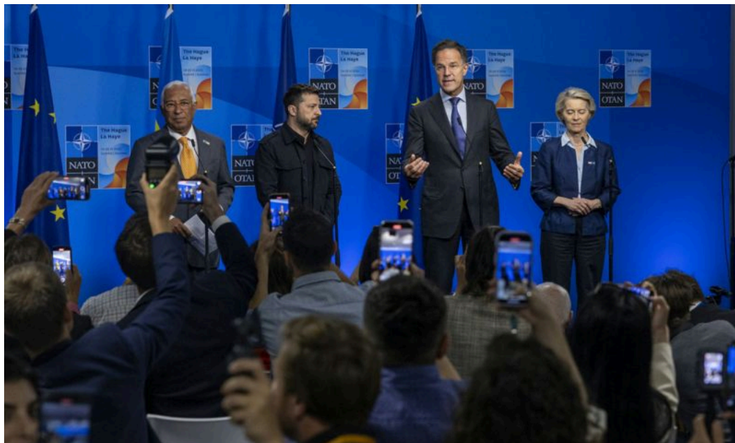
Июнь 2025 года: (слева направо) Антониу Коста (президент Европейского совета), Владимир Зеленский (президент Украины), генеральный секретарь НАТО Марк Рютте и Урсула фон дер Ляйен (президент Европейской комиссии)