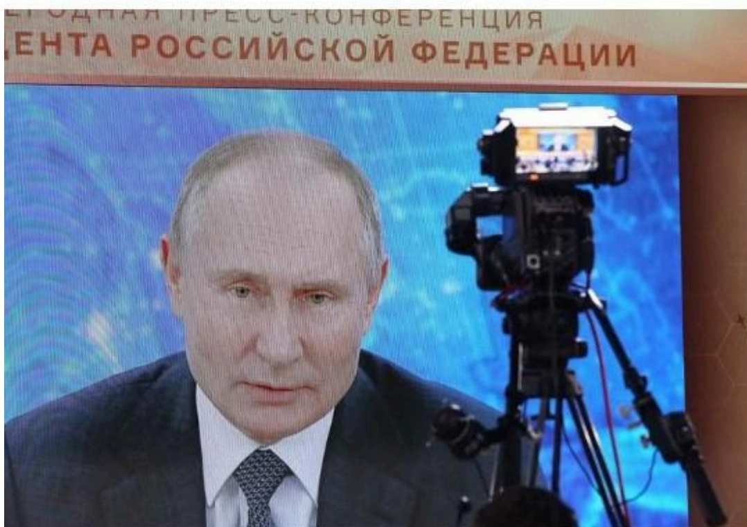
Journalists watch a live broadcast of Vladimir Putin delivering his annual address, Dec 17, 2020.

Учитывая, что судьба российского гражданина Алексея Навального не сходит с заголовков на Западе, стоит напомнить, что совсем недавно в украинской тюрьме в результате пыток и отсутствия медицинской помощи умер американский гражданин Гонсало Лира , о чем люди могли узнать разве что по стрекотанию сверчков.